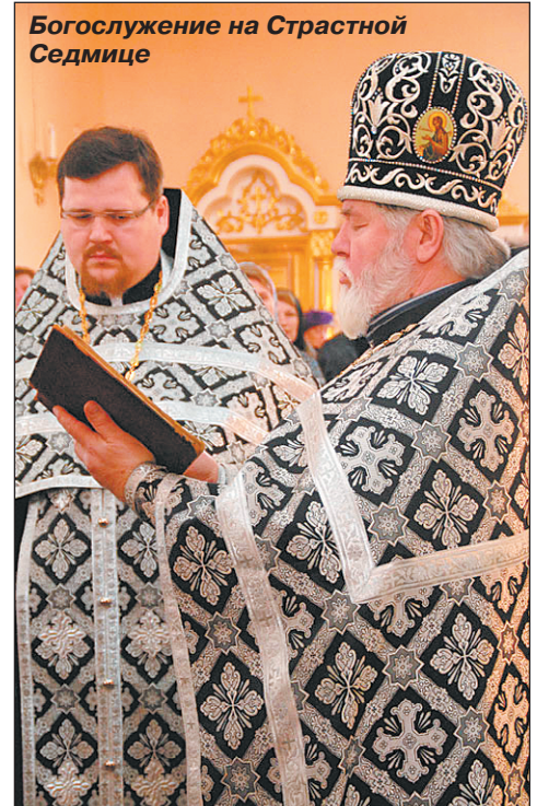
Богослужение на Страстной Седмице